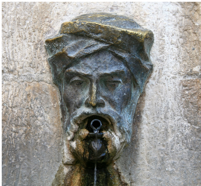
Efigie de la font de la plaça Major d'Alcalà de la Jovada

continuen vivint en la mateixa harmonia i treballen aquesta noble terra conjuntament. Ací, durant el meu regnat, eixien les processons de Setmana Santa i els cristians professaven la religió amb llibertat, ja que l'Alcorà reconeix Jesucrist i la Mare de Déu. Espere que concediu el mateix tracte als musulmans de València”.